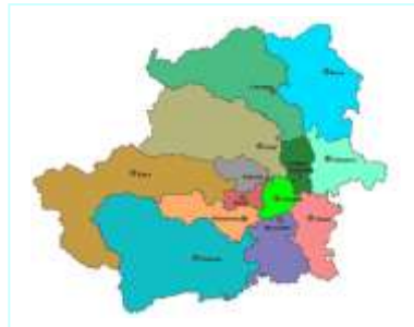
Provincia di Torino